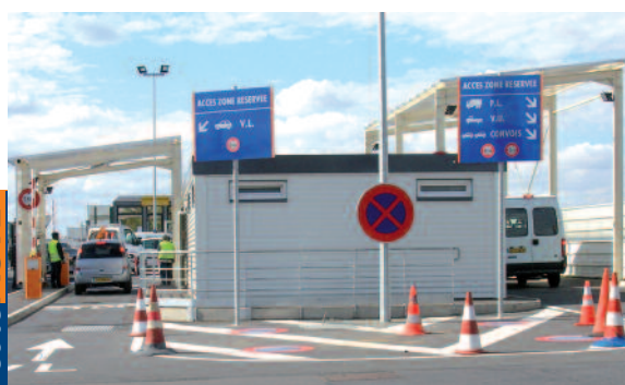
← Véhicules légers d'un côté, utilitaires et poids lourds de l'autre.

Le système de double voie voitures/camions fonctionne de 6h à 19h. Au-delà et toute la nuit, le trafic étant moindre, les contrôles et les inspections s'effectuent au bâtiment 444 pour tous les véhicules. Enfin, toujours pour éviter les embouteillages, le sens de circulation autour du Parif va être modifié. La rue de Copenhague, notamment, sera élargie afin que les véhicules ne tournent plus ni à gauche ni à droite, avenue de l'Europe.